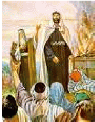
Samuel vertoont Saul

Voor ons mensen zou het mogelijk van meer en groter geloofsvertrouwen hebben getuigd wanneer Rebekka en Jakob hadden afgewacht hoe Elohim zou hebben ingegrepen. Abraham heeft immers zulk een groot geloof gedemonstreerd, toen hij Izaak moest offeren, en op het laatste moment daarin verhinderd werd. Op gelijke wijze zou Jahweh ook hebben ingegrepen wanneer Izaak de