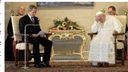
"Oh shit, he is even dumber than I thought"

staat het doen en laten van de mens onder goddelijk "richtend bestuur". Regeringsleiders, hoe goddeloos zij ook zijn, laten gaarne zien hoe religieus zij evenwel zijn. Clinton haalt God ook overal bij aan. En de nieuwe president Bush is al even schijnheilig. Wanneer hij naar de kerk gaat of bidt, als satanist en lid van de Skull & Bones, doet hij dat aan satan. Bush jr is satanist, zie het bewijs op de foto, waar hij een satans-teken maakt met zijn vingers.