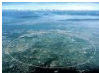
De CERN-ring onder de grond

De heer Schrödinger is één van de uitvinders van de quantum-mechanica en weet hoe schokkend de ervaring is van mensen die voor het eerst met deze nieuwe wereld in aanraking komen. Dat wat wij mensen waarnemen is immers niet de ware werkelijkheid. Achter onze waarnemingen gaat de wáre werkelijkheid schuil. Wij leven in een waan-beeld. Niet dat het een fata morgana is, want dat is onwerkelijk. Nee, wij leven in een soort werkelijkheid, die echter verschilt van de wáre werkelijkheid.