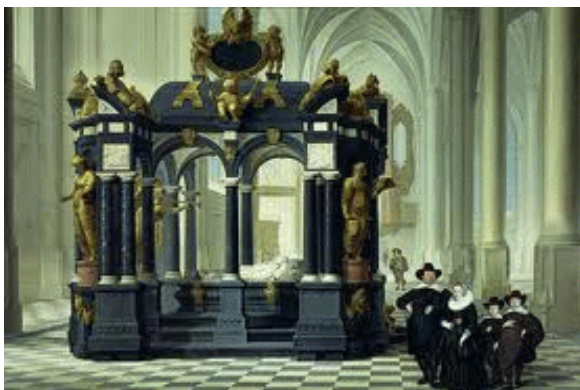
Praalgraf Willem van Oranje

Vrouwen mochten zelfs tijden lang niet deelnemen aan de Eucharistie. Vanzelf konden vrouwen dus géén ambtsdraagsters zijn. Wél begroef men rijken in de kerken of kathedralen, waardoor het gebouw permanent onrein is, zoals de Nieuwe Kerk in Delft waar de Oranjes liggen.