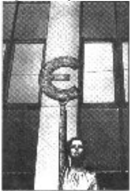
De godin Europa

Geblinddoekt zijn wij door onze politici de Europese Superstaat binnengeleid. Maastricht (het verdrag van Maastricht) heeft alle landen verkocht aan het federale Europa. Het Verenigd Europa heeft onze stem niet meer nodig. Een publiek debat behoort niet meer tot onze rechten en vrijheden (Tot zover Goldsmith).