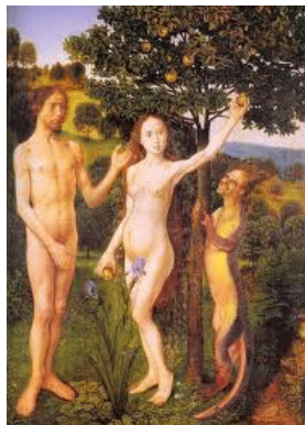
Nachash als reptiel

Eros is liefde, en een deel daarvan is erotiek. Zonder erotiek zou het leven geen tederheid hebben. Men moet echter niet denken dat alle Eros erotiek zou zijn en Eros altijd met de geslachtelijkheid te maken heeft. Men kan immers geslachtelijke relaties hebben zónder erotiek. En men kan erotische relaties hebben zónder seksualiteit. En om dit laatste gaat het ons in dezen. De Grieken hadden Eros in hun theologie opgenomen, maar dat bleek voor de christelijke religies een onmogelijkheid. En waarom? Wanneer de kerken over liefde spreken, bedoelen zij niet Eros (erao), maar agapè. Erao = liefhebben, Eros = liefde. Deze uitdrukking komt als Grieks woord in het N.T. niet voor. Wel gebruikt de Septuagint het woord Eros, maar dan in negatieve zin, als de ontuchtige liefde van afgodendienaars. De Grieken gebruikten altijd Eros en Erao, maar weinig Agapèn. De Bijbel gebruikt juist wél agapèn, en phlio (vriendschap). De Agapèn is de liefde die van Boven afdaalt, en die haar oorsprong niet in de mens vindt. Rom.5:5, Gal.5:22. Dat wil echter niet zeggen dat de agapèn buiten de Eros omgaat! De kerken kunnen Eros niet prediken, helaas! Agapè betekent ook wel liefde, maar dan een onbelichaamde liefde, nog wel gericht op de naaste, maar meer afstandelijk. Wanneer de kerken over liefde spreken leggen zij dat het liefst geestelijk uit. Die liefde moet nog wel uit het hart voortkomen, maar niet uit het gevoel, want dat komt volgens de kerken te dicht bij het erotische!