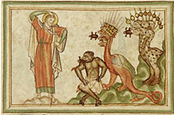
De kleinste figuur wijst naar Nachash

Eva had kunnen weten dat Nachash niet geïnspireerd was, doordat hij Elohim tot Leugenaar stelde (gij zult de dood niet serven). Nachash heeft waarschijnlijk wél het bewijs van zijn kennis aangaande procreatie (voortplanting) kunnen tonen aan Eva,