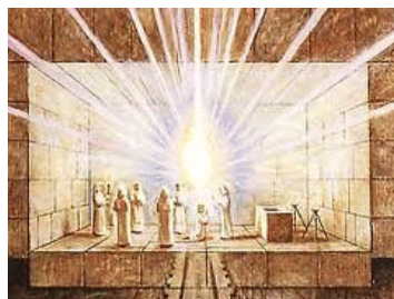
Tempel te Luxor

Dromen werden hier in verband gebracht met ziekte en genezing, of dat de patiënt zelf de oplossing vanuit zijn onderbewuste zou aandragen tot zijn genezing. Ook Freud (dieptepsycholoog) ontdekte het verband tussen dromen en genezing. Een lucide droom is een heldere droom, waarbij de dromer zich bewust is dat hij droomt. Onderzoekers hebben vastgesteld dat tijdens dromen de gesloten ogen zich heen en weer bewegen (REM). Kennelijk kijkt de