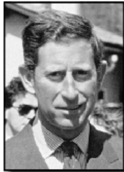
PRINCE CHARLES— will he prove to be the antichrist?