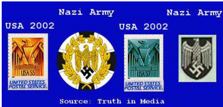
USA en NAZI-symboliek, weinig of geen verschil