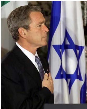
Bush bij Isr-vlag

z o a l s Apollo 11, d i e zogenaamd op de maan zou zijn geweest, z i e www.moontruth.com