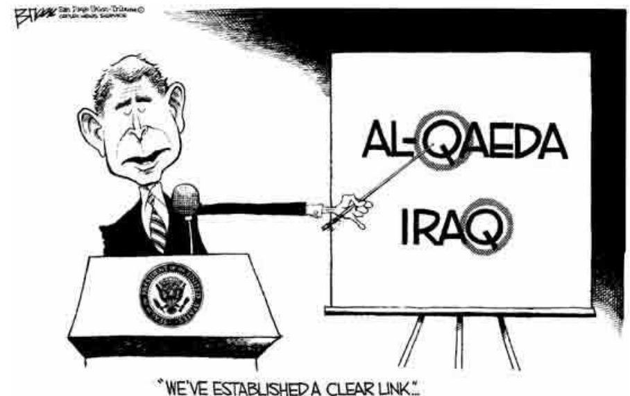
Figuur4 De waarheid is simpel: Je kijkt maar naar de letter Q en de link is gelegd.

We vermoorden mensen om ze te redden. We liegen tegen journalisten en bedriegen het volk uit naam van de persvrijheid. En we vegen een dictatuur onder het bommentapijt en noemen dat democratie”.