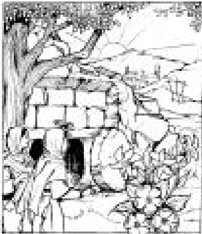
Zeg het allen dat Hij leeft!

waarschijnlijk niet op vrijdag, maar op een woensdag 14 Abib in het jaar 31. Opdat vervuld zou worden het Jonateken.