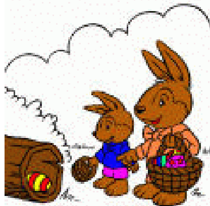
Paasfeest met paashazen

Ook het derde feest lijkt Schriftuurlijk, maar mist elke grond. Het zogenaamde "kerkelijk pascha" houdt men immers niet op 14 Abib, maar op een willekeurige datum. Pascha is ook niet een gedachtenisfeest aan de opstanding. Pascha in het geheel is het Feest der uittocht uit Egypte.