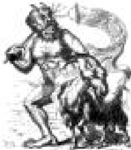
Weggaande bok Azazel

De zonde én de bewerker ervan worden beide verwijderd!