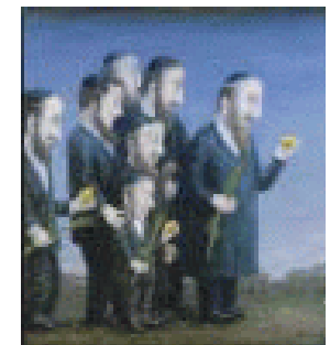
Loofhuttenzetting met de loelab