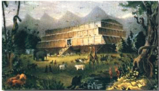
Ark van Noach

Waarom wordt het natuurverbond het eerst genoemd in de Schrift? Omdat de natuur eerst moet worden vrijgemaakt. Pas daarna kan het Adamsgeslacht of vrouwenzaad in harmonie met de