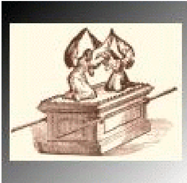
De verbondskist of ark

Het verdrag is enerzijds zakelijk, anderzijds is de plicht vrijwillig, waarbij het loon groot is en de bedreiging gewis. Israël is door Jahweh genomen uit pure liefde. Liefde verplicht tot vrije wederliefde. Zakelijkheid en goedheid sluiten elkaar in een verbond niet uit. Door middel van het verdrag heeft Jahweh Israël de mogelijkheid gegeven dat het zijn eigen welvaart kon bewerken. Jahweh had ook Israël in de watten kunnen leggen, door b.v. blijvend het manna te laten regenen, zodat het niet het land zou behoeven te bebouwen. Hij had goud als stenen kunnen laten delven, zodat het schatrijk zou zijn geworden. Maar nee, Hij verschafte Israël gezondheid bij gehoorzaamheid, zodat het met de gegeven middelen eigen welvaart