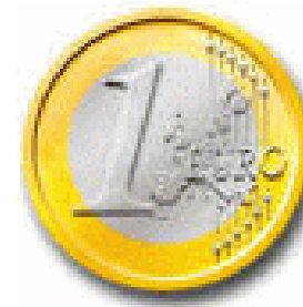
De Euro met 6 strepen, boven 6 sterren en onder 6 sterren = 666

opgebouwd en menen dat dit de enige werkelijkheid is. Onze hersenen zijn vandaag de dag zó geconditioneerd door allerlei ingewikkelde theorieën en zienswijzen, dat ze een probleem hebben om de ware eenvoud nog te herkennen. Wij worden gedreven, voornamelijk door onze hebzucht. Wanneer wij moeten kiezen tussen Jahweh en mamon, kiezen wij voor de macht van het geld. Dit, terwijl geld een eigen schepping van de mens is. Geld berust op misleiding en bedrog. Geld heeft nagenoeg geen intrinsieke waarde meer. Alleen als fictie heeft het waarde, n.l. de waarde die wij eraan toekennen. En toch hangen nagenoeg álle mensen op aarde aan geld. Bij inflatie zien we geld wegsmelten als was voor de zon, en dan vergaat onze hoop. Het is raar maar waar, wat ook gemanipuleerd wordt met geld, de mensen blijven er in geloven!