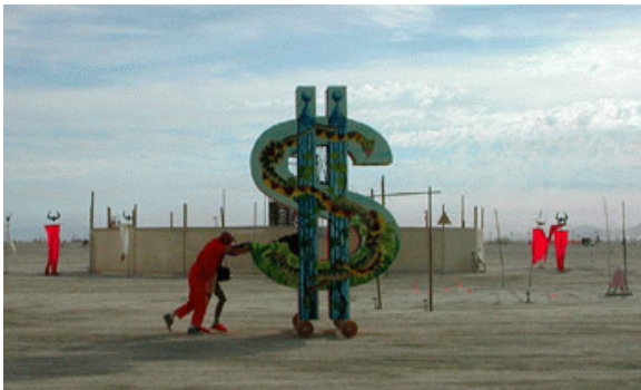
USA-dollar-teken, slang met twee phallussen