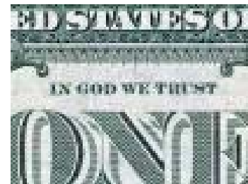
De Amerikaanse dollar

In de ogen van al deze rijke mensen had Jesjoea het bij het verkeerde eind, wanneer Hij een rijke een dwaas noemde. De gelijkenis had een andere titel moeten krijgen, nl. de rijke wijze man!