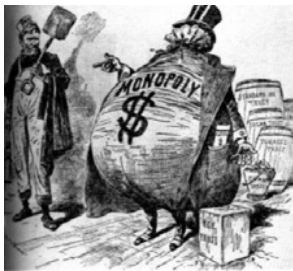
John.D.Rockefeller Standard Oil monopoly kartoon

In vorige eeuwen was men voor o.a. rubber geheel afhankelijk van enkele landen waar de rubberbomen goed groeiden, zoals Indo-China en Ceylon. In heel Amerika en Europa wil geen enkele rubberboom groeien. Vandaar de afhankelijkheid en het ontstaan van monopolies. Zo is het eveneens met rietsuiker, rijst en koffie, wat in het Westen niet kan worden verbouwd. Wij zijn daarvoor geheel afhankelijk van de tropische landen. Voor een erts als tin zijn wij bijna geheel afhankelijk van Bolivia, daar het Westen nagenoeg geen tin heeft. Tarwe echter komt weer uit Argentinië, Amerika, Australië en Europa. Driekwart van alle katoen groeit in Amerika. Voor onze voeding, kleding en energie zijn we afhankelijk van de grote monopolies die de markten beheersen. Shell en Standard Oil beheersen de grote wereldmarkten, waarmee zij bijna alle naties op aarde in hun macht hebben. Canada heeft het monopolie van nikkel, daar het ongeveer 90% van de wereldproductie levert. Ook produceert Canada 6x zoveel tarwe als het zelf nodig heeft.