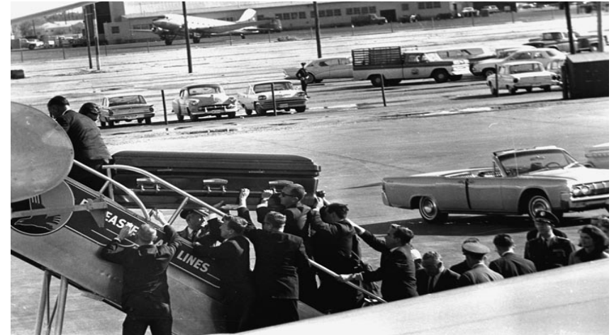
Lijkkist waarin JFK zou liggen

televisie uitgezonden, maar weer in vergetelheid geraakt. Op de foto's was te zien dat Kennedy slechts één oog kon gebruiken en dat zijn rechterarm verlamd was. Ook vele anderen hebben Kennedy op het eiland Skorprios gezien.