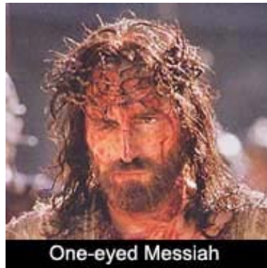
Jezus als "piraat"

Een één-ogige Messias of Jezus-figuur. Het rechteroog van Jezus in de film na de geseling is donker, dof, niet in werking. Wij worden geconfronteerd met een Messias met één oog, en alzo sterft Hij en staat ermee op. Het éne oog wijst volgens de voornoemde groepen christenen naar het Alziend Oog van de Egyptische god Horus, zoals afgebeeld op het Amerikaanse Grootzegel. Ook tijdens de opstandings-scene in de film heeft Jezus nog slechts één oog waaruit Hij kan zien. Jezus wandelt in de film naakt uit het graf.