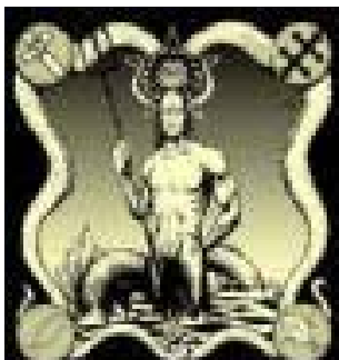
Centaur uit de zee

Eerst zal JFK de leider worden van de EU. Hij was veel in Europa, voornamelijk in Griekenland, ter voorbereiding op zijn Europees leiderschap, als zijnde een Romeinse Prins, of als de koning van het nieuwe moderne Babylon.