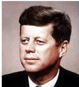
John F. Kennedy

Het antwoord is, dat men de bekende JFK, John Fitzgerald Kennedy ervoor houdt deze omgeschreven figuur te zijn. Kennedy was de jongste man die ooit in de VS tot president werd gekozen, en ook de jongste die zou zijn overleden als gevolg van een aanslag. Kennedy