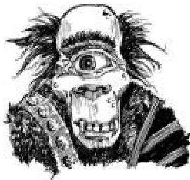
Een cycloop of één-oogig persoon

In het Brits Historisch museum te Londen is de schedel van een cycloop te zien.