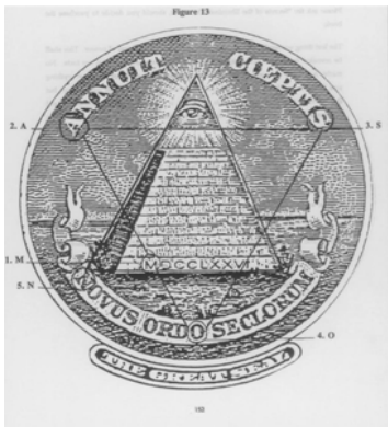
Keerzijde van het USA-grootzegel

Het logo van Gibsons Icon Productions is een één-oog, zoals ook in het USA-grootzegel is te zien.