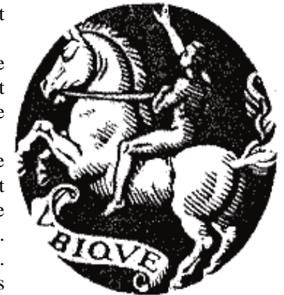
De eenogige naakte rijder van Iove op het witte paard

Zoals gezegd is dit een film van Mel Gibson welke gaat over de laatste 12 aardse uren van Jezus. De film oogst veel lof en evenzo veel kritiek. Waarin Gibson is geslaagd, is het feit dat de film de aandacht van het grote publiek heeft getrokken. De kosten van deze film bedragen ongeveer 25 - 30 miljoen dollar. De opbrengst zal vele malen hoger zijn, gezien de enorme toeloop. Gibson wil het lijden van Jezus laten zien zoals dat werkelijk geweest is. Dat is uiterst moeilijk, zoal niet onmogelijk. "Recht voor je raap, schokkend om de werkelijkheid te zien met je eigen ogen. Je ziet de gebeurtenissen zoals ze hebben plaatsgevonden", zeggen sommigen.