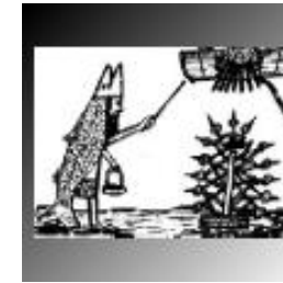
Dagon met mijter