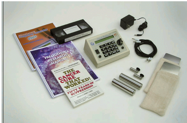
De Global Wellness tm Plus, geavanceerde Rife-machine

Aan zieke mensen valt te verdienen, zelfs heel veel. Vooral wanneer kanker volksziekte één begint te worden, rinkelt de kassa. De behandelingsmethoden -bestraling en chemokuren- zoals hiervoor genoemd blijken in veel gevallen zinloos. Veel medici willen niet inzien dat kanker mede wordt veroorzaakt door ons eetwijze, leefwijze, besmetting met radioactiviteit, stralingen, elektrosmog, etc.