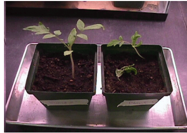
Linker plant gevoed met normaal water, rechter plant gevoed met fluorwater, 25 dagen lang

De Wereld Gezondheids Organisatie signaleert een epidemie door snacks, frisdrank en fabrieksvoeding. De voedingsindustrie ligt onder vuur, daar snacks, frisdranken en andere producten uit fabrieken bijdragen aan de onrustbarende stijging van chronische ziekten in deze wereld, die de omvang van een epidemie hebben aangenomen, volgens experts. Ongeveer 60% van de 56,5 miljoen sterfgevallen in 2001 moet worden toegeschreven aan deze chronische ziekten. De verwachting is dat het aandeel in het sterftecijfer zal oplopen tot 75% in 2020. In een rapport van deskundigen staat dat wij de producten van de voedingsindustrie moeten mijden, daar ze teveel vet, suikers en zout bevatten. Jaap Seidell, hoogleraar voeding en gezondheid aan de VU in Amsterdam vindt dat men de voedingsbedrijven moet betrekken in voeding en gezondheid. Regeringen moeten het voortouw nemen in de strijd voor betere eet- en leefgewoonten. Er dient een wereldwijde standaard te komen voor gezonde voeding, volgens Seidell.