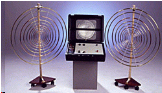
De Multi Wave Oscillator