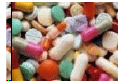
Wat men medicijnen noemt

De religieuze gevoelens in mensen konden niet door de christelijke zendelingen, noch door de Inquisitie, noch door anderen worden uitgeroeid. Men probeerde het ene geloof in te ruilen voor het andere. Het protestantisme, Voodoo, Hindoeïsme, Islam en vele andere religies bestaan nog steeds voort, ondanks geweld dat er tegen is begaan. Ook de verwachte secularisatie van de huidige samenleving is niet ingetreden, zoals werd verwacht door de Illuminati. Men heeft geprobeerd onze jeugd te bombarderen met drugs, sex, geweld via tv, film en andere dingen, om