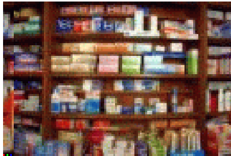
Een apotheek vol

De chemische “geneesmiddelen” industrie is ongelukkig genoeg een goed florerende sector. Ziekten leveren enorme winsten op. Tot op heden zoekt de mens(heid) nog naar geneesmiddelen om hen van hun kwalen af te helpen, zonder zich af te vragen hoe die kwalen konden ontstaan. Men wil de eigen