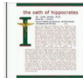
De eed van Hippocrates

Het leven is ook vol problemen, die we zelf geschapen hebben. Wanneer men het boek van Kurt G. Blüchel leest “Heilen verboden, toten erlaubt”, (Gezond maken verboden, doden toegestaan) vraag je je af in wat voor tegengestelde wereld wij eigenlijk leven. Blüchel is al een 40 tal jaren kenner en onderzoeker van de farmaceutische industrie en beschrijft de georganiseerde criminaliteit van het Duitse gezondheidswezen. (Dokter