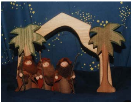
De wijzen zagen Zijn ster in het Oosten

De vroedvrouw was verbaasd. Toen de vroedvrouw en Jozef in de grot kwamen, overschaduwde een lichtende wolkkolom de grot. De vroedvrouw bekende dat zij nog nooit zulke grote dingen had gezien, en dat zij geloofde dat dit de Losser van Israël was die nu