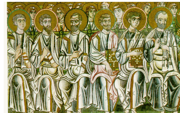
Concilie van Nicea 325

God is volgens Jesaja degene die Zich verborgen houdt, zie Jesaja 45:15 Voorwaar, Gij zijt een God, Die Zich verborgen houdt, de God Israels, de Heiland.