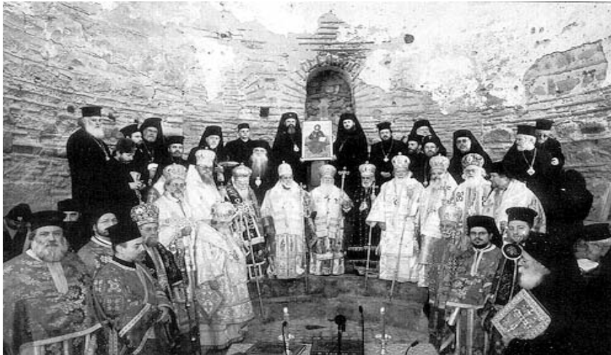
De clerus, gedeeltelijk van een witte 'god', van een zwarte 'god', en van een grijze 'god', tezamen een soort drie-eenheid?

Het christelijk zintuiglijke denken heeft ervan gemaakt dat Gods rechtvaardigheid de dood eiste van Zijn Zoon, om zondaren te redden. De idee dat de Vader zijn Zoon offerde komt voort uit de zintuiglijke denkwereld. Hij was immers Jahweh, die Zichzelf offerde als Geest, door Zich met ons te verbinden als mens! De christelijke kerk heeft vanaf haar begin zich verlaten op de zintuiglijke denkwijze over God en Zijn plan. De kerk liet zich leiden door dogma's, en niet door de Geest. Alles draaide om de zintuiglijke verlangens van de mens te bevredigen. De clerus wist wel beter en bevredigde steeds zichzelf op voortreffelijke wijze, maar de leken