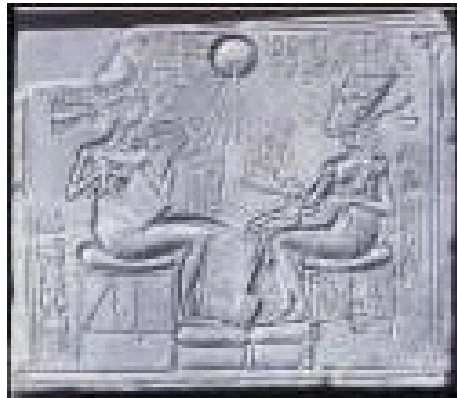
Akhenaton onder de Zongod Ra/Horus

dachten ook de Israëlieten zich de godheid in als bestaande uit meerdere goden (polytheïsme), gezien Elohim een meervoudsvorm is. In plaats daarvan toonde Jahweh dat Hij één is, (monotheïsme). In Egypte kende men oorspronkelijk meerdere goden. Het was Farao Akhenaton die een enkele God (de zon) erkende en de meervoudsvormen die boven de