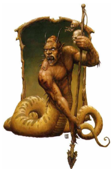
De god Mammon

zodat bijna elk mens in deze geciviliseerde maatschappij er aan meedoet en niet zonder kan. Deze geldgod bepaalt ons lot, onze wereldpolitiek, ons godsdienstig denken, en heel het handelen der mensheid, Jes.57:21.