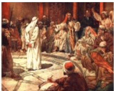
Voor het Sanhedrin