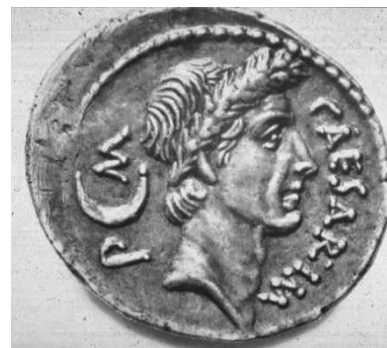
Denarie met PM-opschrift

Pas in een later stadium beschuldigde men Hem van Godslastering, waarschijnlijk op grond van een verbod in hun Talmud..