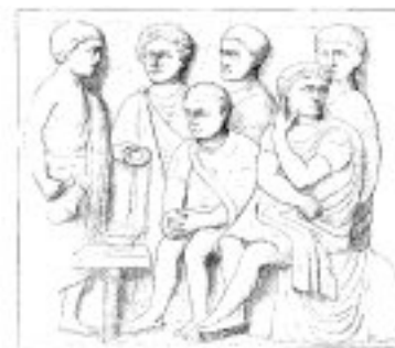
Pilatus wast zijn handen in onschuld

Pilatus willigde tenslotte de eis der massa in en gaf Jesjoea over om gedood te worden. Van opstand werd Jesjoea beschuldigd, maar toen duidelijk bleek dat Hij geen enkele opstand wilde, moest Hij evenwel worden gedood!