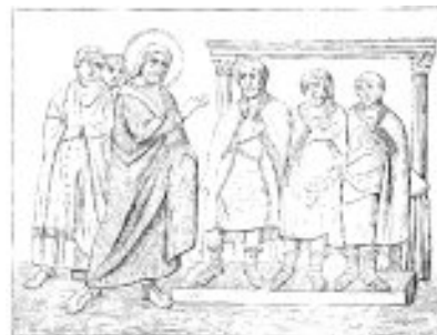
Voor de Hoge Raad

Al met al betrof het hier géén ordelijk proces, maar een onordelijk verhoor, waar men naarstig zocht naar harde feiten om Hem te kunnen beschuldigen. En een zo overspannen situatie wordt elk woord wat men spreekt op weegschalen gewogen!