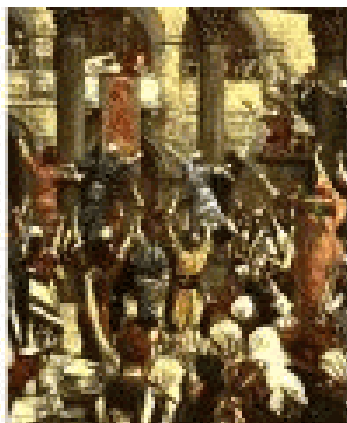
Het volk eist de vloekdood van Jesjoea

Helaas, nee! Pilatus riep daarna uit: Ecco Homo! Ziet de mens! U, o joden, aanschouw deze door jullie nijd en blinde waan toetgetakelde mens! Het mocht niet baten!