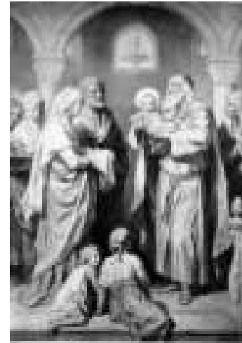
Simeon en Anna

meer in de stadscultuur te vinden was. Op het veld, op de akkers, op het vlakke veld, op de velden van Efratha, in de heggen en steggen, dáár vond men nog de Simeons, de Anna's en de Maria's, die heilbegerig uitzagen naar de vertrooster van Israël. Door de stedelingen werden deze armen weliswaar onderdrukt. Zij waren er soms heel slecht aan toe. Tot hen richtte Jesjoea de zaligsprekingen. Niet in de stadscultuur, maar in Judea, Galilea en Samaria zocht Jesjoea de verloren schapen, en wel op het platte land. De joden met hun Talmuedische traditie sloten de Samaritanen er buiten. Jesjoea niet. Hij wees de Samaritanen wel op hun fouten, maar stak hen wel Zijn reddende hand toe. Hij wees de vrouw bij de waterput erop dat zij wel vijf mannen had gehad -wat kan wijzen naar de vijf rollen van Mozes-, maar dat ze nu geen directe verbinding meer had met Jahweh. Jahweh was haar enige échte man.