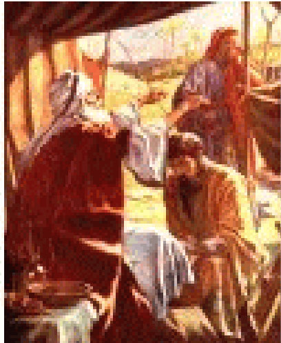
Izaak zegent Jakob

ondersteuning. Jakob echter verwacht het van de genade alleen, van het bovennatuurlijke. Ezau wil het oude slechts repareren; Jakob verwacht algehele vernieuwing, wedergeboorte. Ezau heeft zich vooral in de eindtijd machtig gemaakt en het juk van Jakob afgeworpen.