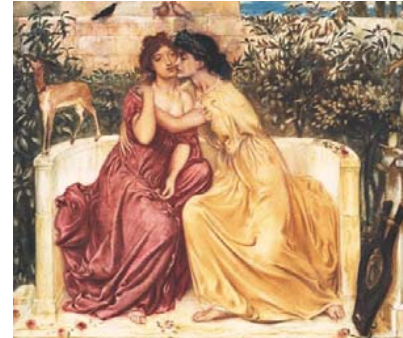
Salomo met Sulamith

1 Johannes 4:9 Hierin is de liefde Gods jegens ons geopenbaard, dat God Zijn eniggeboren Zoon gezonden heeft in de wereld, opdat wij zouden leven door Hem.