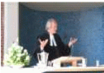
De protestantse dominee

Er waren ook leiders in de Gemeente die de naam “engel” kregen, zie Openb.2-3. Engel = boodschapper. Het kiezen van ouderlingen is een zaak van hoog gewicht voor een Gemeente, vandaar de opsomming van vereisten in 1Tim.3:2 Tit.1:6. Speciale reglementen waar al de ambtelijke werkzaamheden van de oudsten in stonden zijn nooit gegeven.