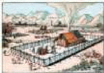
De Tabernakel in de woestijn

De grote ontsporing bestond hierin dat de Gemeente als geloofs-gemeenschap werd