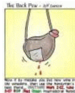
Geen nieuw stuk op een oude zak

Zo te zien lijkt het dat de oude kerkstructuren die oorspronkelijk gegroeid zijn om het Evangelie te bevorderen, ten laatste onbekwaam worden om het Evangelie nog te bevatten. De oude kerkstructuren moeten deswege niet als enige mogelijkheid worden gezien! De christelijke kerkdiensten zijn overgenomen uit oud-Egypte. De kerkvaders hebben de kerkdiensten niet een eigen vorm gegeven, maar hebben deze ontleend aan de oude school-idee uit Egypte. Daar gaf de leraar les in de klas, en als herscholing