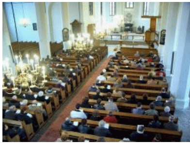
De traditionele kerkdienst

Geboden is de Spijswetten in acht te nemen; nee, men eet alles wat onrein