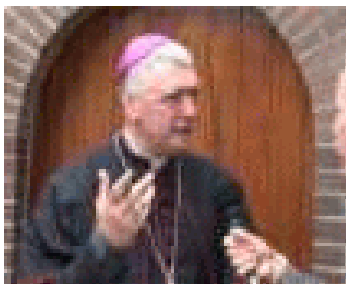
Een R.K. bisschop

Het idee van een grote volkskerk is onbijbels. Het moet een onderlinge bijeenkomst zijn en blijven, een gemeenschapsoefening van gelovigen. De dominee zoals die nu functioneert zal uit de Gemeente moeten verdwijnen. Daarmee halen wij wel de hoeksteen en steunpilaar weg van onder het huidige kerkelijke systeem! Dominees-ambten zijn onschriftuurlijk, iets dat niet in de Gemeente van Christus thuishoort. Herders en Leraars zijn daar nodig. Daar kon men niet voor afstuderen en zich beroepbaar stellen. Nee,