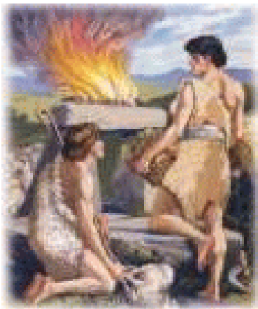
Kaïn en Abel

Vanuit ieders eigen geestesgesteldheid offerden zij. Kaïn zag met eigen ogen dat Abels offer werd aangenomen en het zijne werd afgewezen. Dat bracht hem in grote verwarring. Hij wist het niet meer. Kaïn wist wel dat hij anders was dan Abel, en zag wel dat hij de vroomheid miste van zijn broer, maar dat kon hij toch niet