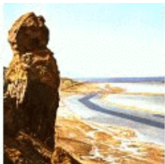
Zoutpilaar, vrouw van Lot

Gemis kan diep ingrijpen en pijn doen. Gemis heeft de neiging achterom te kijken, zoals de vrouw van Lot. Je bent immers iets kwijt, je hebt iets verloren. Dat geeft onrust, want je wilt het weer terug hebben. Sommige zaken verlies je definitief en kun je nooit meer terug krijgen. Dan is het meestal de dood die een scheiding maakt. Het is een ware levenskunst om steeds meer afscheid te kunnen nemen van dat wat wij missen, wanneer wij weten dat het gemis definitief is. Wij mogen ons immers niet blijven vastklampen aan wat voorbij is en niet meer terugkomt, hoe moeilijk dat