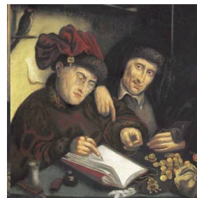
De ontvanger, Rotterdams museum

bureaucratie omvat in ons land ongeveer één miljoen ambtenaren, met evenveel vaak overbodige regelgevingen. Het werk dat veel ambtenaren verrichten geschiedt meestal erg traag en onkundig, veelal tegenwerkend en niet welzijns- en welvaarts-bevorderend. Ook dat is diefstal van het levensgenot der bevolking, en derving van levensvreugde. Via verschillende pensioenfondsen waar wij aan moeten betalen vindt er jaarlijks een gelegaliseerde staatsdiefstal plaats die enkele miljarden omvat. Het rendement van de pensioenfondsen is uiteindelijk maar zeer karig.