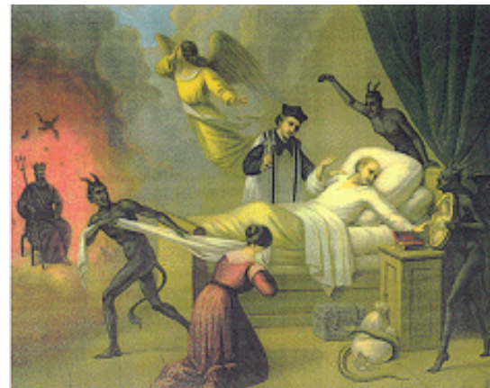
Middeleeuwse voorstelling van sterfbed, waarbij de keus zou vallen van hemel of hel

Indien Paulus in de abstracte Onveranderlijke had geloofd, had hij nooit voor Israëls bekering kunnen bidden, 10:1, daar alles immers reeds vast zou hebben gestaan.