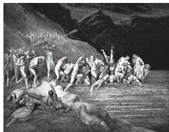
De hel volgens Dante

De Drie Formulieren van Enigheid gaan ervan uit dat aan de één wél de genadegave van geloof om niet wordt geschonken, en aan de ander niet. En waarom? Alleen omdat “God” Zich zou ontfermen over wie Hij wil en anderen zou verharden wie Hij wil, is hun antwoord. God zou er een register (boekhouding) op na houden waarin de namen van de verworpen mensen staan, volgens Judas vers 4, zie ook de kanttekening 1 Statenvertaling daarbij.