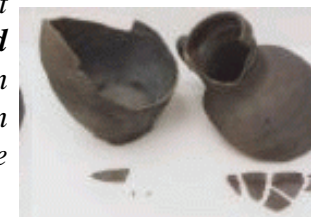
Een gebroken kruik

11 En gij zult tot hen zeggen: Zo zegt de HEERE der heirscharen: Alzo zal Ik dit volk en deze stad verbreken, gelijk als men een pottenbakkersvat verbreekt, dat niet weder geheeld kan worden; en zij zullen hen in Tofeth begraven, omdat er geen andere plaats zal zijn om te begraven.