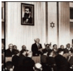
Ben Goerion 15 mei 1948

P.30: Wij behoeven er ons dus niet over te verbazen, dat wij in den Staat Israël geen herleving der Theocratie zien. Naar de H.Schrift hebben wij die ook niet te verwachten. Hetgeen ons evenwel niet verhindert de totstandkoming van dezen staat als een merkwaardige gebeurtenis in het historisch proces der volkerenwereld te beschouwen en diens verdere ontwikkeling met bijzondere belangstelling te volgen.