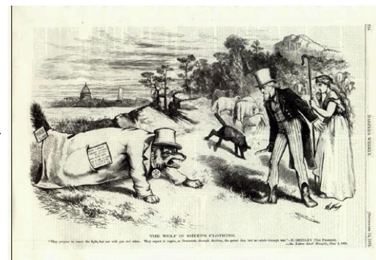
Wolven in schaapskleren

Onwetende joden worden foutief voorgelicht door hun leiders, zoals oud-premier Golda Meir het in 1971 zei: " Dit land bestaat als