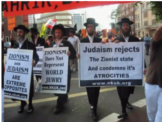
Orthodoxe joden demonstreren tegen het zionisme

Dat wil zeggen: We are the best, and kill the rest!