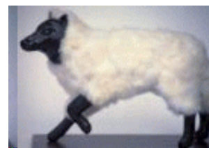
Wolf in schaapskleren

In Johannes 7:35 staat niet in de Griekse tekst: 'verstrooide Grieken', maar er staat letterlijk: ' verstrooiden onder de Grieken ', d.w.z. de verstrooide schapen van het Huis Israëls ónder de Grieken!