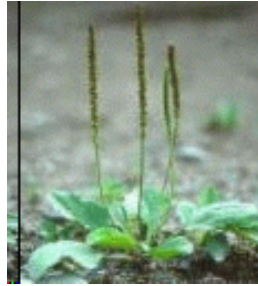
Onkruid, ongewenst groen

30 Laat ze beiden te zamen opwassen tot den oogst, en in den tijd des oogstes zal ik tot de maaiers zeggen: Vergadert eerst dat onkruid, en bindt het in busselen, om hetzelfde te verbranden; maar brengt de tarwe samen in mijn schuur.