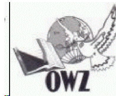
Logo van een wereldzendingbond

Men meende stellig dat men vanwege het geloof " alle vreemde niet-Israëlvolkere tot Zijn discipelen " moest gaan maken.