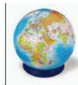
De gehele wereld

15:26vv. De discipelen vertoefden temidden van de wolven , zie Mattheus 10:16, dit wijst naar een zeer kwaadaardig soort mensen. Jesjoea noemt hen “dit geslacht” van moordenaars, dat Abel gedood heeft tot Zacharia toe. Het bloed zal van hen geëist worden! En in Johannes 8:44 geeft Hij hen de naam “adderengebroid”.