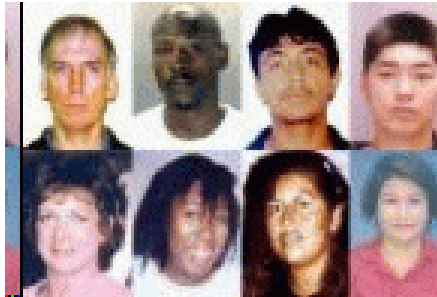
Vershillende etnische soorten

vertrouwing van de koning, want niet-Israëlieten vertrouwen elkaar slecht, en nemen daarvoor een blanke. In de grondtaal staat dat hij een euneuch was, dat is een ontmande. Hij mocht daardoor