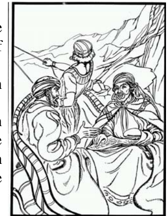
De kamerling leest Jesaja

(Vers 37 is een latere toevoeging en hoort niet in de grondtekst.) De moorman was naar Jeruzalem gegaan om te aanbidden. Hij was de