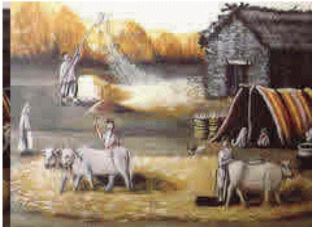
Ouderwetse dorsvloer met schuur