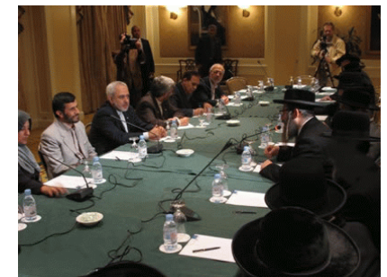
Orthodoxe joden op bezoek in Iran, in gesprek met regeringsleiders, tijdens de Holocaust tentoonstelling 2007.