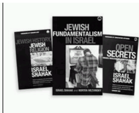
Drie boeken van prof. Shahaq

Het volgende is een bevestiging van iets dat ik stel in het artikel onder de titel "Jakob heb Ik liefgehad, Ezau heb Ik gehaat". Het was een van de eerste ontdekkingen toen ik begon met dit onderwerp te bestuderen. Wat is dat voor een ontdekking? Niet alle 'joden' zijn van Juda, net zoals Openbaring 2:9 en 3:9 ons vertellen. Zij zijn Edomieten en indringers, die zichzelf voorstellen als Het Huis van Juda en dat met een heel slecht doel.