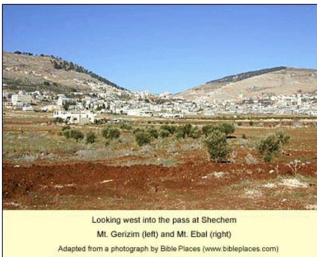
Looking west into the pass at Shechem

JHWH heeft Zijn aangezicht over u verheven en geeft u vrede!