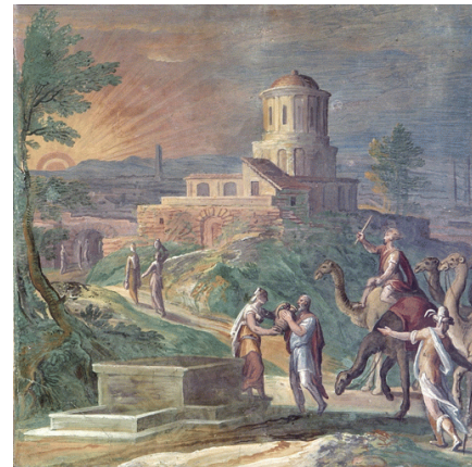
Rebekka geeft Eliëzar water te drinken

Eliëzer trok er met een karavaan op uit en kwam in Haran en zette zich bij een waterput. Een waterput is een ontmoetingsplaats, waar men al gauw de weg kan vragen aan de bewoners van die streek, die daar hun vee laten drinken. Wij lezen vervolgens in Genesis 24 hoe Eliëzer tewerk is gegaan: