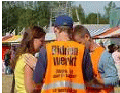
In het Brabantse Liempde kan men voor je bidden tijdens het Xnoizz Flevo Festival. Hemels Inter@ctief noemt men dat. Of het succes heeft is maar de vraag, en wat heet 'succes'?

Heel het leven is één samenhang. Wij zijn zaadjes van onze Hemelse Vader, die als Landman zaait. Wijzelf mogen ons zaadje bevochtigen door ons bidden, zodat het kan ontkiemen en vrucht dragen. Het gaat Jahweh om de vrucht. Met Hem te communiceren, Die het diepst van ons hart kent en onze nieren proeft.