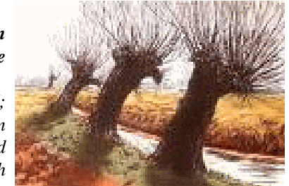
Wilgen aan waterbeken

5 Deze zal zeggen: Ik ben van JHWH; en die zal zich noemen met den naam van Jakob; en gene zal met zijn hand schrijven: Ik ben van JHWH, en zich toenoemen met den naam van Israël.