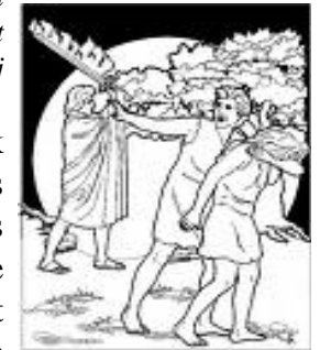
Adam en Eva uit de Hof verdreven