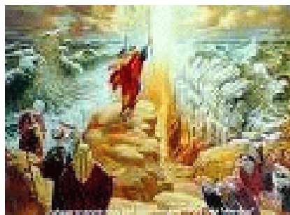
Doortocht Rode Zee

zijn onze voorvaders wederspanning en eigenzinnig geweest, en ook dat is een Israël-karaktertrek, hoewel verwerpelijk. JHWH moest zich soms in een vijand veranderen en Zich tegen ons keren, uit liefde ons ten goede. Vandaar dat Hij Zich terugtrok, zodat de vraag rijst wáár nu Zijn heilige Geest is die hij ooit in het midden van Zijn volk stelde. Waar is Zijn manifestatie en tegenwoordigheid gebleven? Hij die zulke machtige tekenen en wonderen heeft gedaan tijdens de Exodus, waar is Hij nu? Zie hieronder het relaas: Jesaja 63: