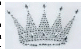
Een sierlijke kroon

Wij zullen echter weer een sierlijke kroon, een diadeem worden in de hand van JHWH. Wij zullen niet meer verstrooid worden onder de vreemde afgodische volkeren. Ons land zal een bijzondere naam ontvangen, nl. het getrouwde, omdat JHWH