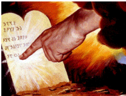
The Ten Commandments were written with God's own finger. The only part of the Bible written directly by God!

De verantwoording ligt bij ons, bij de mens als individu, maar ook nationaal, bij het volk. Wie de weg weet en niet bewandelt, stelt zich in gevaar voor de gevolgen van zijn bewuste onwil tot