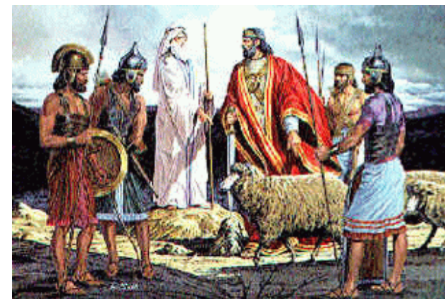
Saul bij Samuel, met de schapen die hij had moeten verbannen

Dat geldt ook voor een heel volk, wat te zien is in het volk Israël toen het in de woestijn vertoefde en daarna. In Jeremia 3 lezen wij over de afgekeerde Israël en haar zuster, het Huis Juda, die het nog erger maakte. JHWH riep hen op tot bekering. Zij weigerden zich te bekeren, aangezien zij een hoerenhoofd hadden. Zij wandelden naar het goeddunken van hun eigen boze hart. Dat kostte het Huis Israel de scheidbrief, waardoor zij hun naam verloren en verstrooid werden over de aarde.