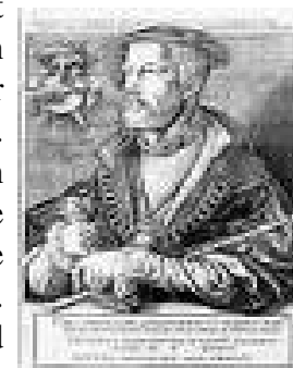
Jan van Leyden

Het is misleiding wanneer men meent dat een christen vrij van de Wet zou zijn. Een christen is weliswaar een koningskind, maar daarom kan hij niet doen wat hij wil. Sommigen prinsen menen ook dat zij boven de wet staan en rijden met hun bolides hoge snelheden. Hij weet zich gevangen onder de gehoorzaamheid van de Wet des Geestes. Het idee van zulk een vrijheid ontaardt altijd in losbandigheid en ergerlijk kwaad, dat hebben wij gezien bij Thomas Müntzer in Duitsland en bij Jan van Leyden in Holland, waar men zelfs naakt op straat ging lopen en allerlei zedeloze praktijken onderhield.