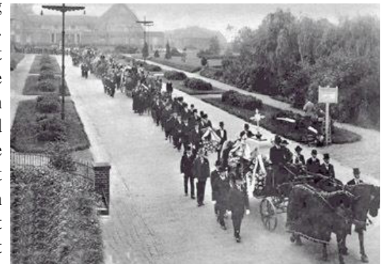
Begrafenisstoef prins Hendrik

e n v o o r b i j g a a n d . Onsterfelijkheid is niet een product van onze i n b e e l d i n g . Een onveranderlijke toestand is gezien de voortdurende verandering van het a a r d s e e e n onmogelijkheid, naar het ons toeschijnt. In alles zit ontwikkeling, waarbij een eindeloze toestand van