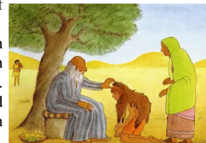
Izaak zegent Jakob

Ezau moge Jakob jarenlang achtervolgen, maar Jakob/Israël krijgt de algehele zegen. De eindoverwinning staat in het begin reeds vast, Gen.3:15.