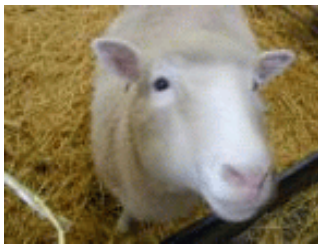
Dolly, het gekloonde schaap

Cellen volgen een streng hiërarchisch systeem bij de celdeling en worden in het geheel gereproduceerd. Daarna wordt er pas beslist welke cel gemobiliseerd moet worden en welke niet. Kunstmatig kan men een heel organisme reproduceren door de kern van een