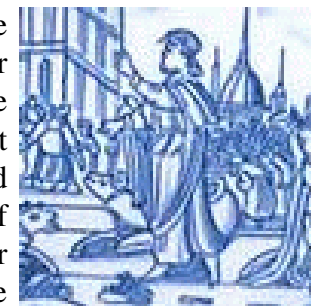
Jona te Nineve

Sodom en Gomorra zouden gevonden zijn, had JHWH die steden niet omgekeerd. Wat de profeten aan gerichten voorzegden komt veelal pas wanneer het volk blijft volharden in het kwaad. Het is in de handen van het volk het oordeel van JHWH af te wenden. De profeten zagen dat de scheefgroei was begonnen met af te wijken van de Wet, waarna zij op hun vingers konden uitrekenen dat dit zou leiden tot totale neergang. Kreeg het volk in te zien waarmee men bezig was, en ontstond er berouw en bekering, dan zette herstel zich in. Evenwel is er niet van toeval sprake. De dagelijkse gang in deze wereld is geen toevalligheid. Toeval bestaat niet. De wereldgebeurtenissen zijn een indicator voor de weg die wij bewandelen naar de toekomst. Het ligt aan onze keuzes wat de uitkomst ervan zal zijn. Wie wind zaait, zal storm oogsten. Wijzelf bedreigen ons eigen voortbestaan door onze foute keuzes en decadente levenswijzen. Wijzelf beschikken over het vermogen om het leven tot een hemel