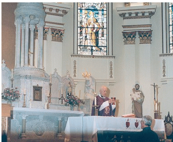
Voorportaal van de hemel, vol mysterieën

en de logica betreffende ons leven en de dood geen reden geven om angst te kweken. De hemel en de hel zijn datgene waaraan wijzelf bouwen in de levensjijd die wij ontvangen, en wel uit de gevolgen van onze daden, onze