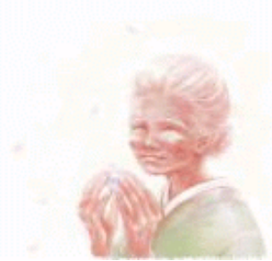
Een oude vrouw

Het leven is heel onzeker. Plotseling kunnen rampen ons treffen, kunnen er in ons lichaam levensbedreigende situaties ontstaan, waardoor wij het leven moeten afleggen. De krantenberichten tonen deze gang van zaken dagelijks. Het sterven is voor ouderen soms een bevrijding, maar voor jongeren een bedreiging. De levensgeest verlaat ons, en wat rest is een levenloos lichaam, dat terugkeert tot de aarde via ontbinding. De levensgeest verlaat het lichaam, en wij weten niet wat daarmee nadien gebeurt. Men kan er hele theorieën op na houden over hemel en hel, maar niemand kan ons exact