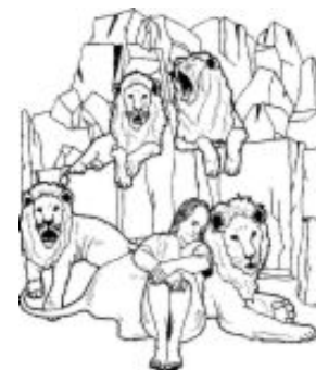
Daniël in de leeuwenkuil

in de vurige oven. Het gaat hier over een letterlijke bescherming, welke haar oorsprong vindt in de bescherming die in het geloof is toegeëigend, aldus Elderenbosch. Hij concludeert dan ook dat de dood waaraan jonge mensen bezwijken voordat zij hun leven hebben vervuld, een zaak is die meer voor rekening van onze verantwoordelijkheid ligt dan we vaak denken.