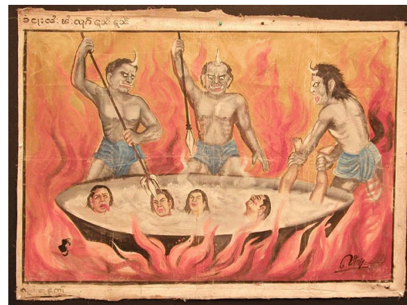
Voorstelling van een helle-tafareel

Zijn schijnbaar kleine hemel, en de rest van ons zou verwijzen, naar een e e u w i g onveranderlijk besluit, naar een tot in eeuwigheid brandende hel. De mens kan geen enkele invloed uitoefenen op Gods besluiten en moet