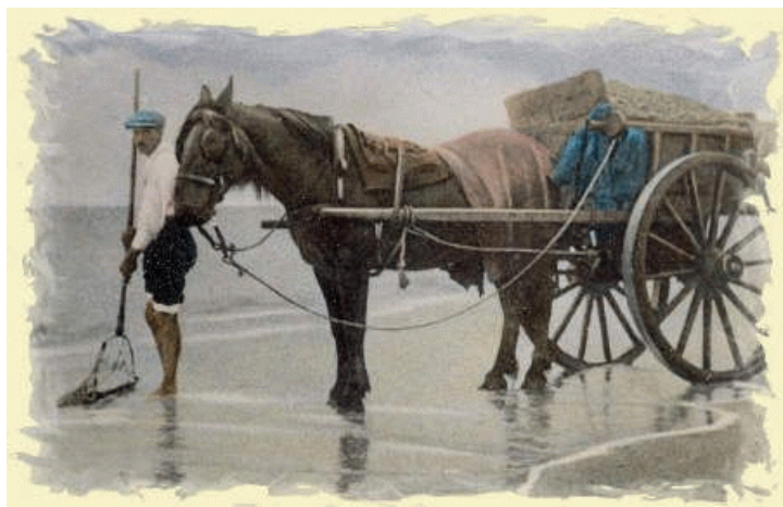
De ouderwetse schelpenvisser op het strand

meest effectieve en rechtvaardige straf. Wel wilde hij dat men gevangenis zou bouwen, waarin veel cellen en een grote open binnenplaats zouden zijn voor de gevangenen, om hen ambachten te leren. Dit zou het economisch nut bevorderen. Hierdoor zou de maatschappij verlost worden van onsociale elementen. In plaats van misdadigers te verminken, kregen zij opvoeding en tucht. Coornhert is te zien als de vader van een meer menselijk strafstelsel. Of hij zich hiermee aan de wetten van JHWH hield, is aanvechtbaar.