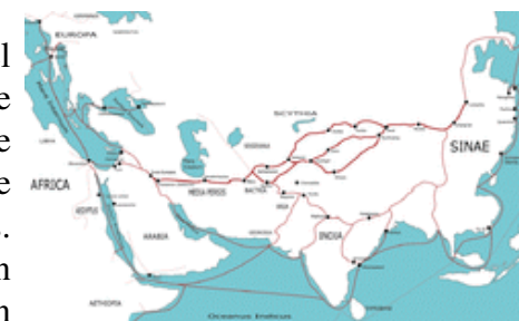
De zgn Silk-route (de zijde-handelsroute)

De noodzaak om door handel in eigen onderhoud te voorzien, bestond voor de Israëlieten niet, omdat de bodem rijk en productief was. Ook was Israël in zijn bloeitijd te veel in oorlogen verwickeld om zich met handel in te laten. Bovenal