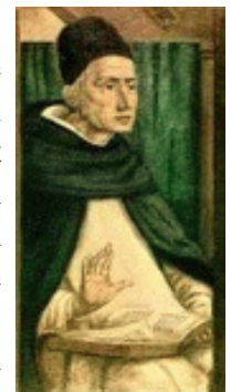
Albertus de Grote

Kennelijk had Tertullianus een slechte levenservaring opgedaan met vrouwen. Zijn leerling was Thomas van Aquino, die beweerde dat de vrouwelijke materie het mannelijke zaad tegenwerkte. Daarom werden er niet altijd jongetjes geboren, maar ook meisjes, als mislukte jongetjes. Ook Albertus de Grote zag de vrouw als mislukte man. Als gevolg van deze kerkelijke visie is er tijdens de Inquisitie heel wat vrouwenleed geleden. De leer van de christelijke kerk is echter