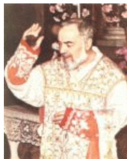
Padre Pio, stigmata

Het kudde-instinct zit diep in ons mensen. Wij lijken veel op papagaaien die alles na-apen, zonder het zich diep bewust te zijn. Om aan deze dierlijke instincten te ontsnappen is een wonder. Slechts weinigen lijkt het gegeven te zijn zelfstandig te denken, en daar vanuit besluiten te nemen. Via media en andere middelen zijn wij mensen gemakkelijk te beïnvloeden. Daarvan maken demagogen en leidinggevenden gretig gebruik. Zij houden de mensen o.a. geestelijke zaken voor, die zij vervolgens op die wijze precies zo gaan beleven. Men hoort gedurig predikaties en voordrachten van zo en zo moet het, en dan komt het zo ook in de mensen op die wijze tot stand via suggestieve verbeelding. Men moet maar eens kijken wat suggestie kan bewerkstelligen bij de Rooms Katholieke mystici, die de stigmata vertonen. Zij leven de kruisdood zó diep in, zodat er bloed in hun handpalmen staat en in hun