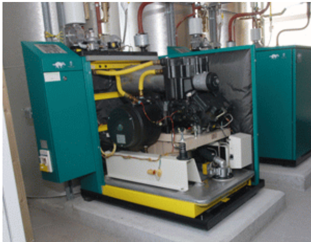
Een Warmte-kracht installatie

Er was eens een Nederlandse ingenieur die een vernuftig apparaat had ontwikkeld. Daarmee konden mensen overal ter wereld hun woningen van stroom en warmte voorzien tegen zeer lage energiekosten. Het apparaat werd naar een Afrikaans land verzonden, enerzijds als proefproject, anderzijds als bijdrage aan ontwikkelingshulp. Het apparaat kwam aan en werd uitgepakt. Duizenden inboorlingen verdrongen zich rondom dit in hun ogen 'achtste wereldwonder'. Helaas, er zat geen instructieboek bij in de taal die aldaar werd gesproken. Niemand kon de taal lezen van het bijgeleverde Nederlandse instructieboek. De inboorlingen begonnen het apparaat te betasten en uit te proberen. Alle schakelaars en knopjes werden aan en uitgedaan. Plotseling kwam er rook uit het apparaat, en alle inboorlingen juichten van vreugde. Zij meenden dat zij de werkwijze van het apparaat hadden ontdekt. Helaas, de rook