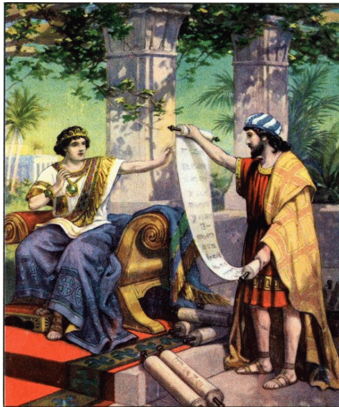
Koning Josia leest de gevonden wetsrol 2 Koningen 23:24

Micha 6:8 Hij heeft u bekend gemaakt, o mens! wat goed is; en wat eist JHWH van u, dan recht te doen, en weldadigheid lief te hebben, en ootmoedigheid te wandelen met uw God?