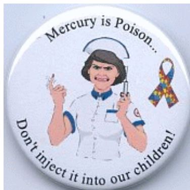
Kwik is gif, gaat dat niet in onze kinderen spuiten!

*This data is available via: www.mercola.com http://articles.mercola.com/sites/article/s/archive/2001/03/07/vaccine-ingredients.aspx http://xandernieuws.punt.nl/?id=532945&r=1&tbl_archief=&