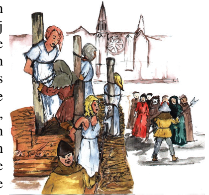
Een autodafé in de naam van God