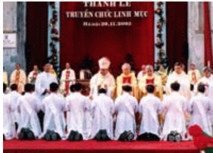
Missionarissen in Vietnam

Missionarissen hebben alle eeuwen door geprobeerd de primitieve volkeren hun geloof (bijgeloof) af te pakken en er hún geloof voor in de plaats te geven. Dat geschiedde soms op brute wijze. Hun methoden werkten (gelukkig) niet, want de mensen bleven hun oude vertrouwde objecten aanbidden. Vandaag de dag is het niet veel anders gelegen met de meeste mensen, waarbij hetzelfde 'geloof' in religies, politieke