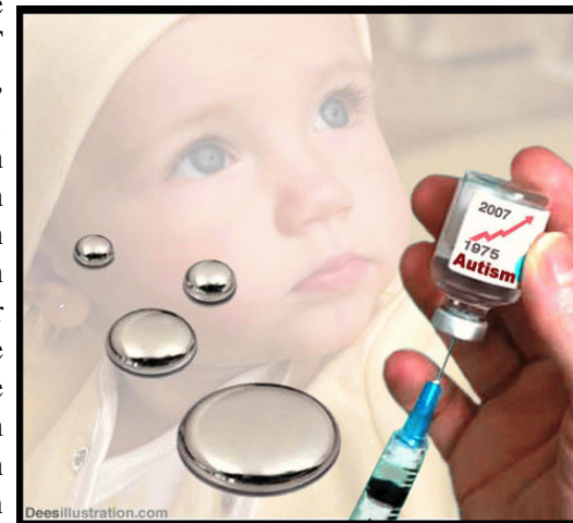
Kwik en aluminium in vaccins, veroorzakers van autisme

- In de VS stegen de kosten van één enkele DKT (Difterie, Kinkhoest, Tetanus) vaccin van 11 cent in 1982 tot $ 11,40 in 1987. De fabrikanten van de vaccins moesten namelijk voor ieder vaccin $ 8 dollar reserveren voor gerechtelijke kosten, die ontstonden omdat ze schadevergoedingen moesten uitbetalen aan ouders wier kinderen een hersenbeschadiging hadden opgelopen of zelfs stierven na deze vaccinatie.