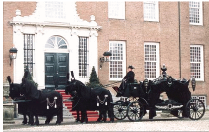
Witte en zwarte rouwkoetsen

Een getuigenis van één hunner luidt: 'Wij vieren de gedachtenis der overledenen niet met treuren,