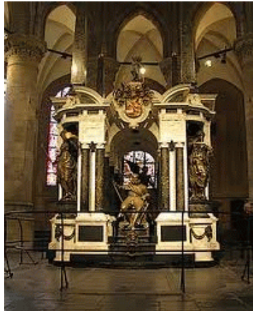
Praalgraf van Willem van Oranje