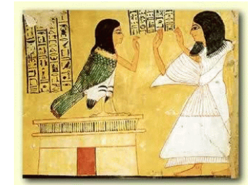
Ba-vogel als ziel in Egypte

In Zacharia 12:1 staat: 'die de geest in het binnenste van de mens formeert'.