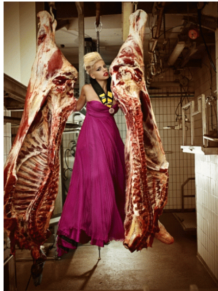
De bevalligheid is bedrog! Liefde tot het vlees, of vleselijke liefde?

5 Indien gij daarentegen deze woorden niet zult horen, zo heb Ik bij Mij gezworen, spreekt JHWH, dat dit huis tot een woestheid worden zal.