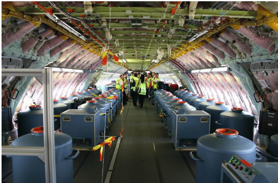
Het inwendige van een vliegtuig waarmee de chemtrails worden gespreeid over onze hoofden

'What in the world are they spraying?' Documentaire over chemtrails