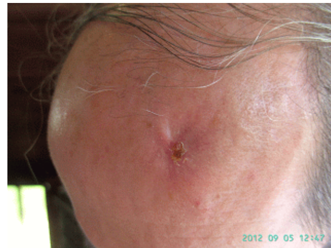
Figuur11 foto is vandaag gemaakt 05-09-2012