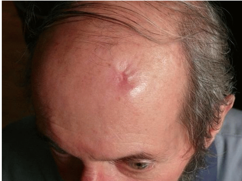
Figuur15 foto 20-09-2012