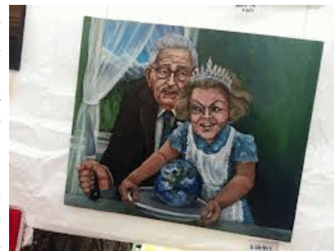
Beatrix en Kissinger verdelen de wereld

Het hakenkruis is het teken van LICHT. Licht = LUCIFER. Het licht