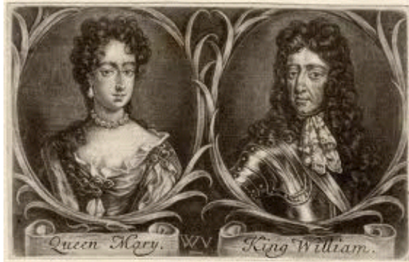
Willem en Mary moesten met elkaar trouwen

Let op de vrome taal waarmee Helvetius de filosoof de bescherming van de Almachtige Willem toebidtd!, is te lezen in het boek: Alchemie. A. Coudert p.50.