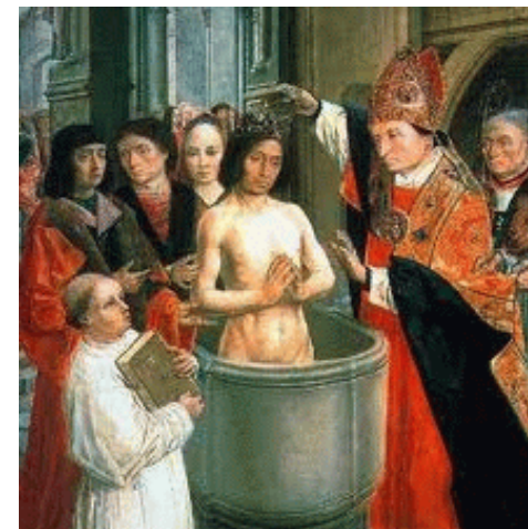
Clovis in 497 gedoopt

De Merovingers werden dan ook niet als gewone koningen gezien, maar als Priester-Koningen, als belichaming van de vleesgeworden god. Hun belangrijkste heilige symbool was de BIJ (de raat is altijd zeskant). In