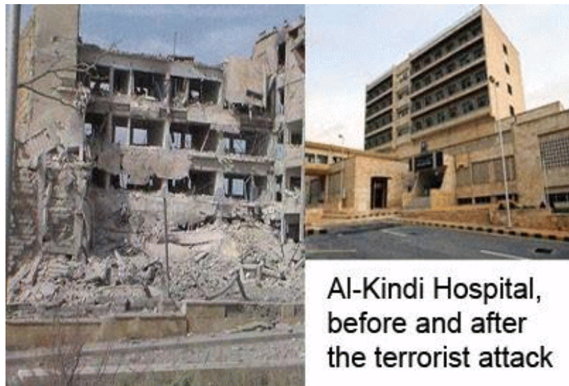
Al-Kindi Hospital, before and after the terrorist attack

In Aleppo Syrië, links na een aanslag ziekenhuizen zijn het doel van NATO-gesteunde groepen.