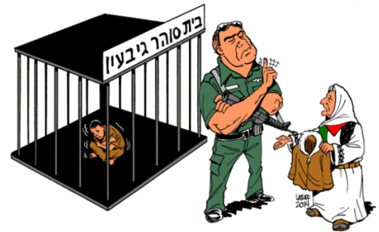
Israehel sluit Palestijnse gevangenen -ook kinderen- op in kooien die buiten in weer en koude wind staan.

http://www.vice.com/nl/Fringes/kingdom-of-germany Bekijk bovenstaande video van een vrijstaat in Wittenberg, de stad van Maarten Luther.