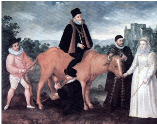
Philip II op de melkkoe de Nederlanden Alva melkt de koe namens Frankrijk trekt de Hertog van Alencon aan de staart Koningin Elisabeth voert stroo Willem de Zwijger probeert kalm te blijven

D'ONDERSATENEN ZYNNIET VANGODTGHESCHAPEN TOTBEHOEF VANDEN PRINCE OMHEMIN ALLES WATHY BEVEELT WEDER HET GODDELICK OFT ONGODDELICK RECHT OFT ONRECHT IS ONDERDANIGH TE WESEN ENDE ALS SLAVEN TE DIENEN MAER DEN PRINCE OM D'ONDERSATEN WILLE SONDER DEWELCKE HY EGEEN PRINCE EN IS OM DESELVE MET RECHT ENDE REDENE TE REGEEREN