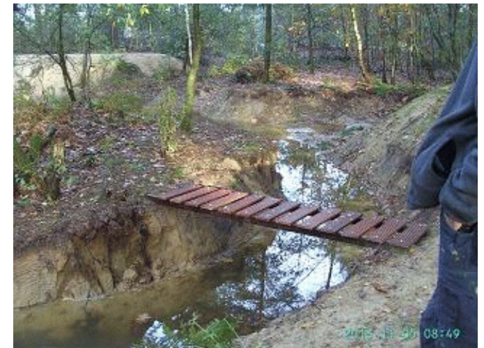
Het bruggetje, waarop 5000 euro dwangsom