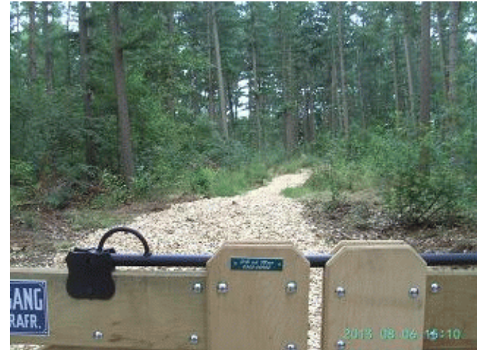
De nieuwe hekken en snippers op de paden, waarop 10.000 euro dwangsommen