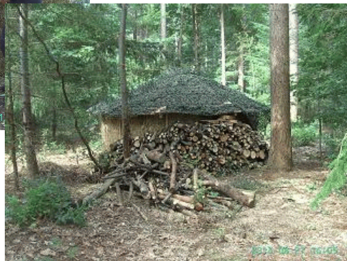
De loofhut van strobalen, die geruimd werd op 21-12-2013